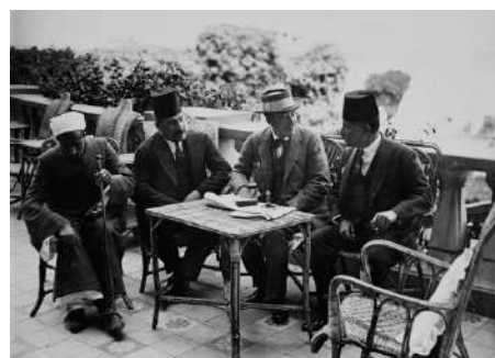
Lord Carnarvon con personalidades egipcias