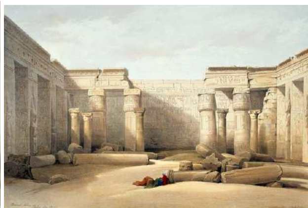
Dibujo de los Colosos de Memnon y del Templo de Ramses III de David Roberts ( 1838)